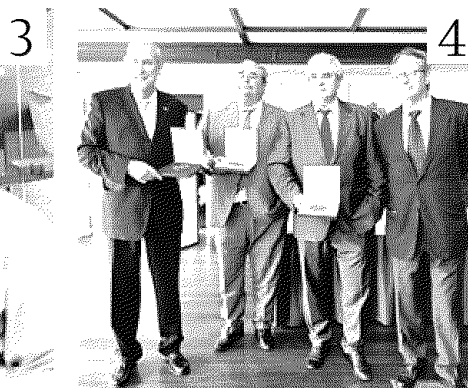
Varios ingenieros recibieron la medalla del colegio